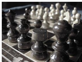
Strategie – statt „Prinzip Hoffnung“

Vieles, was das Leben einfacher und schöner macht, geht an den Finanzchaoten vorbei. Sie erkennen nicht, dass es auch klügeres Handeln gibt, als Feuer zu löschen. Um aber Veränderungen durchzuführen, müssen wir über unseren Kompass nachdenken.